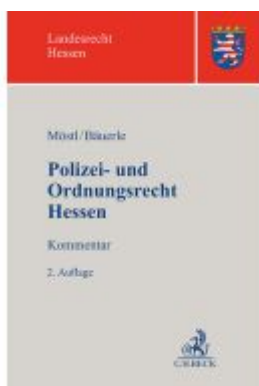
Polizei- und Ordnungsrecht Hessen Ladenpreis: 142,90EUR