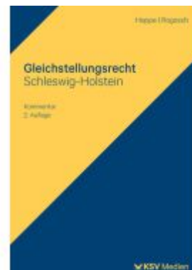
Gleichstellungsrecht Schleswig-Holstein Ladenpreis: 36,00EUR