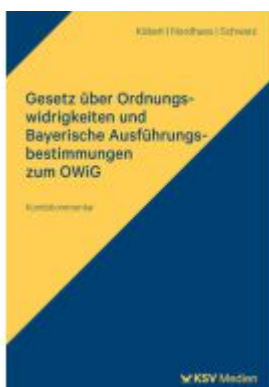
Gesetz über Ordnungswidrigkeiten und Bayerische Ausführungsbestimmungen zum OWiG Ladenpreis: 71,00EUR