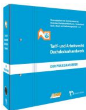
Tarif- und Arbeitsrecht Dachdeckerhandwerk Ladenpreis: 112,10EUR