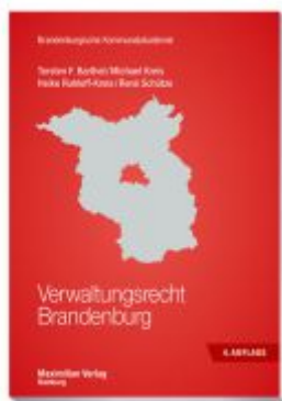
Verwaltungsrecht Brandenburg Ladenpreis: 30,70EUR