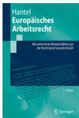
Europäisches Arbeitsrecht Ladenpreis: 33,92EUR