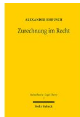
Zurechnung im Recht Ladenpreis: 122,40EUR