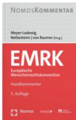
EMRK Europäische Menschenrechtskonvention