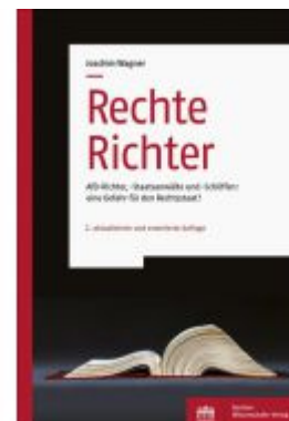
Rechte Richter Ladenpreis: 29,90EUR