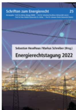
Energierectstagung 2022 Ladenpreis: 62,00EUR