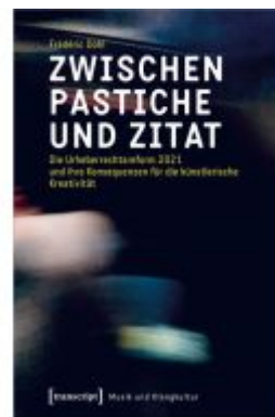
Zwischen Pastiche und Zitat