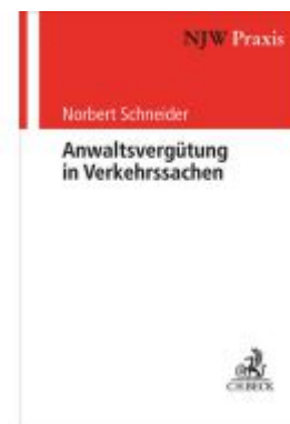
Anwaltsvergütung in Verkehrssachen Ladenpreis: 50,40EUR