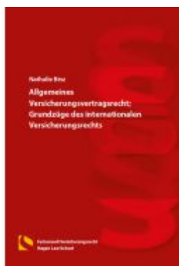
Allgemeines Versicherungsvertragsrecht; Grundzüge des internationalen Versicherungsrechts Ladenpreis: 46,30EUR