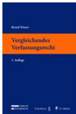
Vergleichendes Verfassungsrecht Ladenpreis: 56,60EUR