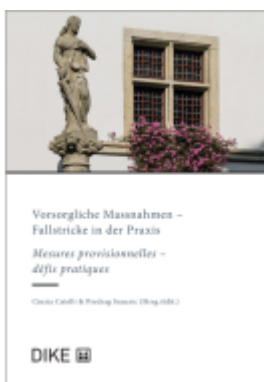
Vorsorgliche Massnahmen - Mesures provisionnelles Ladenpreis: 94,00EUR