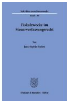
Fiskalzwecke im Steuerverfassungsrecht.