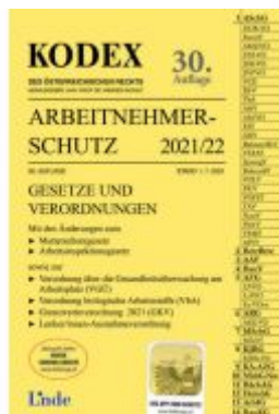
KODEX Arbeitnehmerschutz 2021/22 Ladenpreis: 38,00 EUR