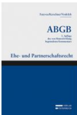
Großkommentar zum ABGB - Klang Kommentar Ladenpreis: 570,00 EUR