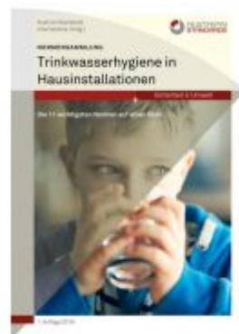
Normensammlung Trinkwasserhygiene in Hausinstallationen Ladenpreis: 174,90 EUR