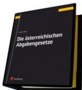
Die österreichischen Abgabengesetze Ladenpreis: 140,00 EUR