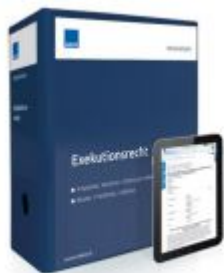
Exekutionsrecht Ladenpreis: 228,90 EUR

Wir haben andere Produkte gefunden, die Ihnen gefallen könnten!