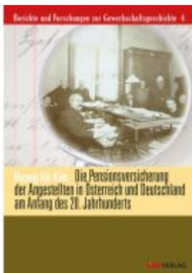
Die Pensionsversicherung der Angestellten in Österreich und Deutschland am Anfang des 20. Jahrhunderts Ladenpreis: 36,00 EUR