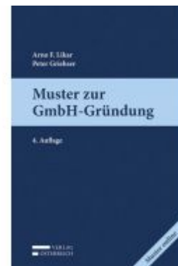
Muster zur GmbH-Gründung Ladenpreis: 52,00 EUR