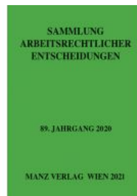
Sammlung arbeitsrechtlicher Entscheidungen Ladenpreis: 264,50 EUR