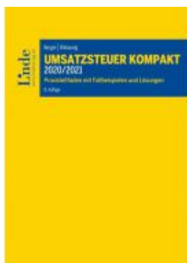
Umsatzsteuer kompakt 2020/2021 Ladenpreis: 59,00 EUR