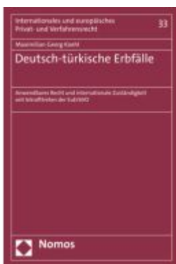
Deutsch-türkische Erbfälle Ladenpreis: 91,50EUR