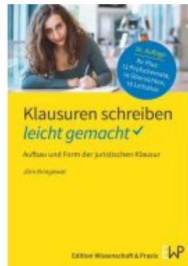
Klausuren schreiben – leicht gemacht Ladenpreis: 15,40EUR