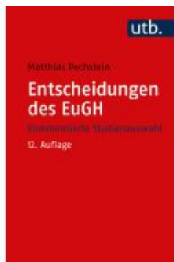
Entscheidungen des EuGH Ladenpreis: 32,90EUR

Wir haben andere Produkte gefunden, die Ihnen gefallen könnten!