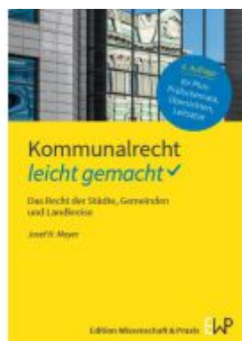
Kommunalrecht – leicht gemacht. Ladenpreis: 15,40EUR