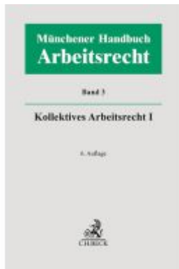
Münchener Handbuch zum Arbeitsrecht Bd. 3: Kollektives Arbeitsrecht I Ladenpreis: 225,20EUR