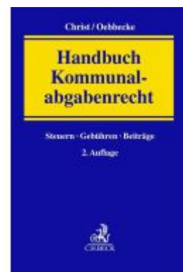
Handbuch Kommunalabgabenrecht Ladenpreis: 153,20EUR