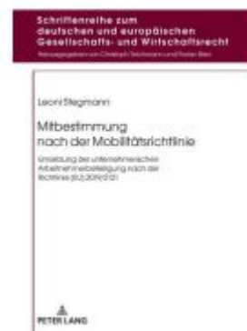
Mitbestimmung nach der Mobilitätsrichtlinie Ladenpreis: 74,00EUR