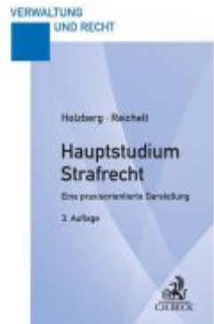
Hauptstudium Strafrecht Ladenpreis: 27,70EUR