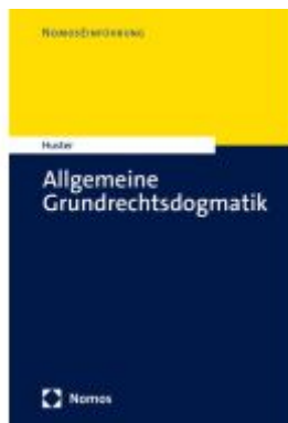
Allgemeine Grundrechtsdogmatik Ladenpreis: 27,70EUR