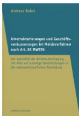
Umstrukturierungen und Geschäftsveräußerungen im Meldeverfahren nach Art. 38 MWSTG Ladenpreis: 42,00EUR