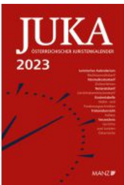
Österreichischer Juristenkalender 2023 JuKa Ladenpreis: 142,00EUR