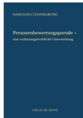
Personenbewertungsportale – eine verfassungsrechtliche Untersuchung Ladenpreis: 91,40EUR