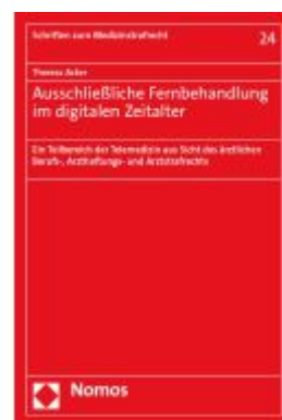
Ausschließliche Fernbehandlung im digitalen Zeitalter Ladenpreis: 122,40EUR