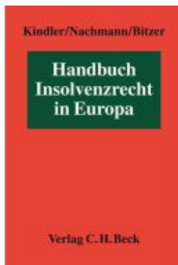
Handbuch Insolvenzrecht in Europa Ladenpreis: 163,50EUR