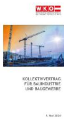
Kollektivvertrag für Bauindustrie und Baugewerbe (Arbeiter) Ladenpreis: 6,90EUR