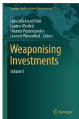
Weaponising Investments Ladenpreis: 197,99EUR