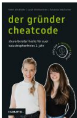
Der Gründer-Cheatcode Ladenpreis: 25,70EUR