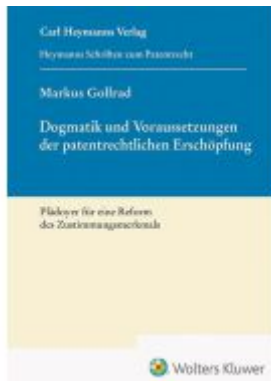
Dogmatik und Voraussetzungen der patentrechtlichen Erschöpfung (HSP 24) Ladenpreis: 81,30EUR