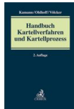
Handbuch Kartellverfahren und Kartellprozess Ladenpreis: 307,40EUR