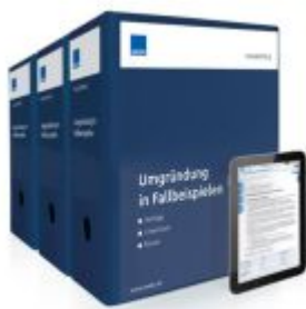
Umgründung in Fallbeispielen Ladenpreis: 283,80EUR