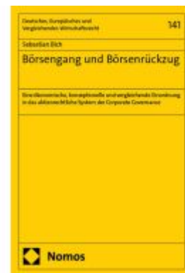
Börsengang und Börsenrückzug Ladenpreis: 112,10EUR