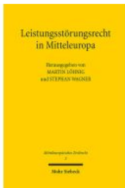
Leistungsstörungenrecht in Mitteleuropa Ladenpreis: 81,30EUR