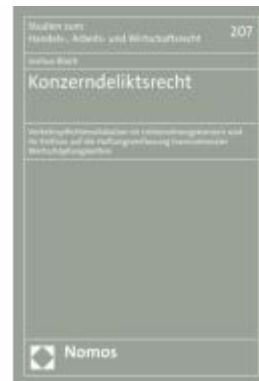
Konzerndeliktsrecht Ladenpreis: 153,20EUR