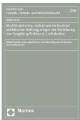
Multistakeholder-Initiativen im Kontext deliktischer Haftung wegen der Verletzung von Sorgfaltspflichten in Lieferketten Ladenpreis: 96,70EUR