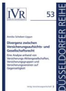
Divergenz zwischen Versicherungsaufsichts- und Gesellschaftsrecht Ladenpreis: 56,40EUR