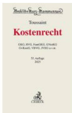
Kostentrecht Ladenpreis: 180,00EUR