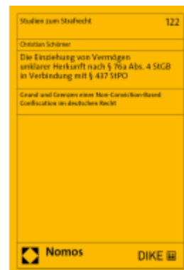
Die Einziehung von Vermögen unklarer Herkunft nach § 76a Abs. 4 StGB in Verbindung mit § 437 StPO Ladenpreis: 134,00EUR