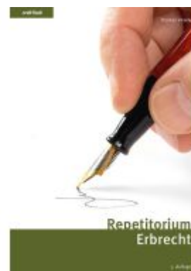
Repetitorium Erbrecht Ladenpreis: 65,80EUR