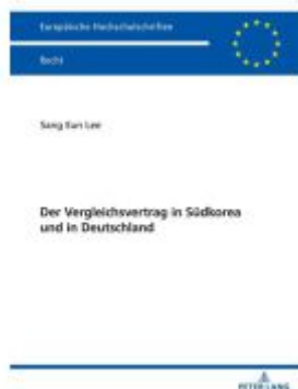
Der Vergleichsvertrag in Südkorea und in Deutschland Ladenpreis: 61,05EUR