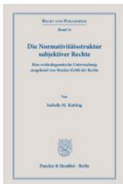
Die Normativitätsstruktur subjektiver Rechte. Ladenpreis: 92,50EUR