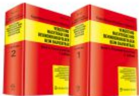
Vergütung, Nachträge und Behinderungsfolgen beim Bauvertrag Ladenpreis: 286,90EUR