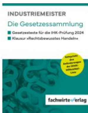
Industriemeister Ladenpreis: 28,80EUR