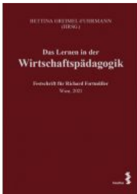
Das Lernen in der Wirtschaftspädagogik Ladenpreis: 34,00EUR