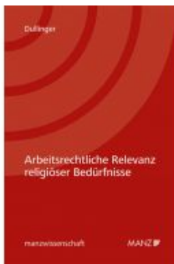
Arbeitsrechtliche Relevanz religiöser Bedürfnisse Ladenpreis: 74,00EUR