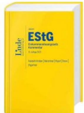
Jakom EStG | Einkommensteuergesetz 2023 Ladenpreis: 145,00EUR