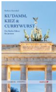
Ku`damm, Kiez und Currywurst Der Berlin- Führer für Juristen Ladenpreis: 29,00EUR