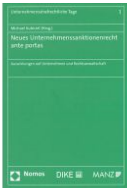
Neues Unternehmenssanktionenrecht ante portas Ladenpreis: 49,00EUR