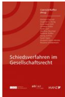
Schiedsverfahren im Gesellschaftsrecht Ladenpreis: 39,00EUR