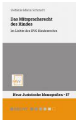
Das Mitspracherecht des Kindes Ladenpreis: 62,00EUR