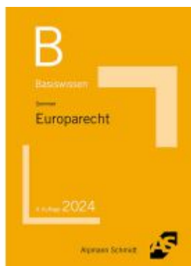
Basiswissen Europarecht Ladenpreis: 13,30EUR