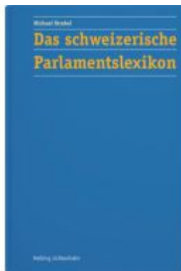
Das schweizerische Parlamentslexikon Ladenpreis: 141,00EUR