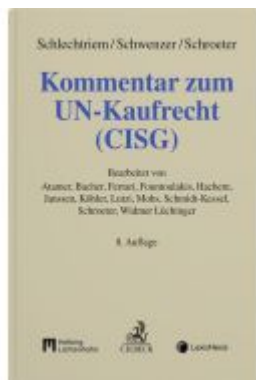
Kommentar zum UN-Kaufrecht (CISG) Ladenpreis: 259,00EUR