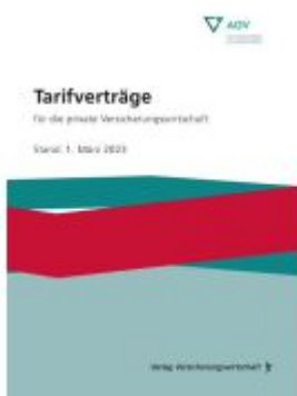
Tarifverträge für die private Versicherungswirtschaft Ladenpreis: 25,50EUR