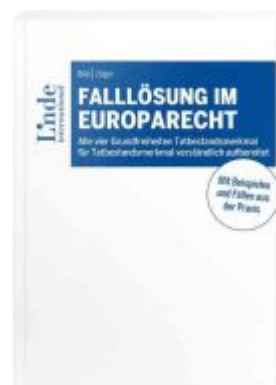
Falllösung im Europarecht Ladenpreis: 30,00EUR