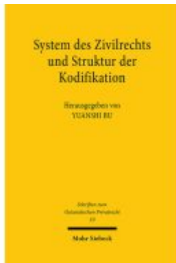
System des Zivilrechts und Struktur der Kodifikation Ladenpreis: 81,30EUR