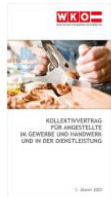
Kollektivvertrag für Angestellte im Gewerbe und Handwerk und in der Dienstleistung Ladenpreis: 6,90EUR