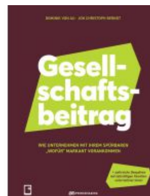
Gesellschaftsbeitrag Ladenpreis: 25,70EUR