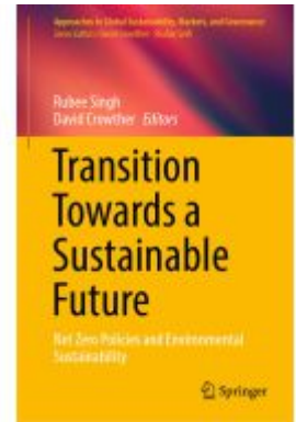
Transition Towards a Sustainable Future Ladenpreis: 197,99EUR