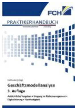
Geschäftsmodellanalyse, 3. Auflage Ladenpreis: 194,30EUR