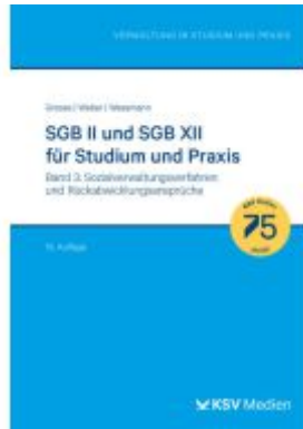
SGB II und SGB XII für Studium und Praxis (Bd. 3/3) Ladenpreis: 41,20EUR