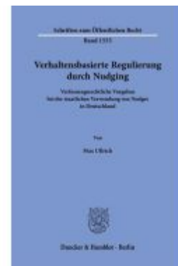
Verhaltensbasierte Regulierung durch Nudging Ladenpreis: 102,70EUR