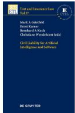
Civil Liability for Artificial Intelligence and Software Ladenpreis: 99,95EUR