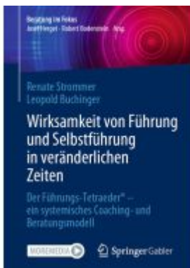
Wirksamkeit von Führung und Selbstführung in veränderlichen Zeiten Ladenpreis: 41,11EUR

Wir haben andere Produkte gefunden, die Ihnen gefallen könnten!