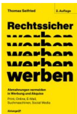
Rechtssicher werben, 2. neubearbeitete und erweiterte Auflage 2023 Ladenpreis: 20,60EUR