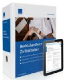
Rechtshandbuch Ziviltechniker Ladenpreis: 239,80 EUR

Wir haben andere Produkte gefunden, die Ihnen gefallen könnten!