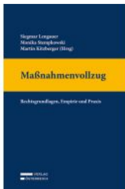
Maßnahmenvollzug Ladenpreis: 119,00 EUR