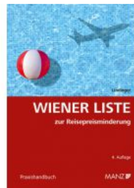
Wiener Liste zur Reisepreisminderung Ladenpreis: 48,00 EUR