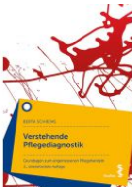
Verstehende Pflegediagnostik Ladenpreis: 32,90 EUR