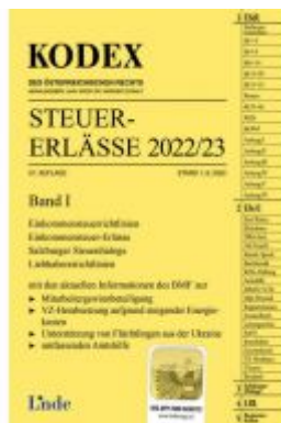
KODEX Steuer-Erlässe 2022/23, Band I Ladenpreis: 61,00 EUR