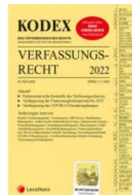
KODEX Verfassungsrecht 2022 - inkl. App Ladenpreis: 36,00 EUR