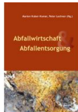
Abfallwirtschaft & Abfallentsorgung Ladenpreis: 32,00 EUR