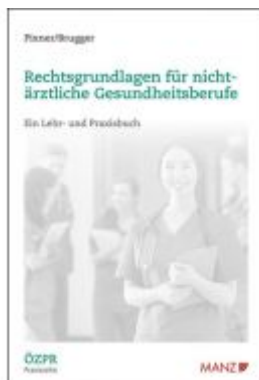
Rechtsgrundlagen für nicht-ärztliche Gesundheitsberufe Ladenpreis: 36,00 EUR