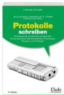
Protokolle schreiben Ladenpreis: 19,90 EUR