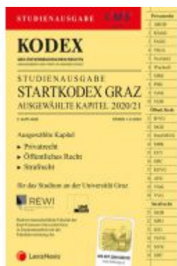
KODEX Startkodex Graz 2020/21 Ladenpreis: 19,00 EUR