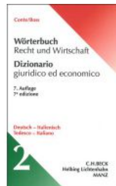
Wörterbuch Recht und Wirtschaft Deutsch - Italienisch - Italienisch Ladenpreis: 91,50 EUR