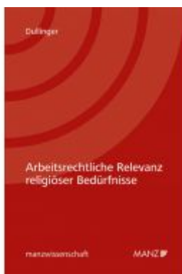
Arbeitsrechtliche Relevanz religiöser Bedürfnisse Ladenpreis: 74,00 EUR