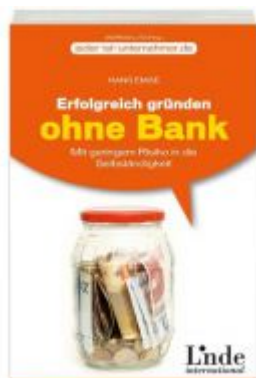
Erfolgreich gründen ohne Bank Ladenpreis: 18,40 EUR

Wir haben andere Produkte gefunden, die Ihnen gefallen könnten!