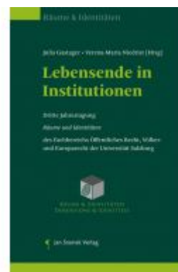
Lebensende in Institutionen Ladenpreis: 55,00 EUR