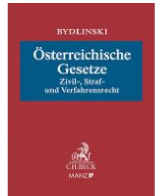
Österreichische Gesetze Ladenpreis: 148,00 EUR