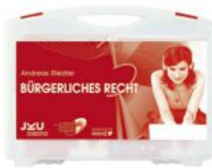
Medienkoffer Bürgerliches Recht Ladenpreis: 322,30 EUR