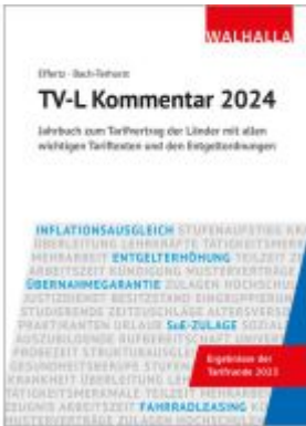
TV-L Kommentar 2024 Ladenpreis: 48,30EUR