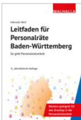
Leitfaden für Personalräte Baden- Württemberg Ladenpreis: 36,00EUR