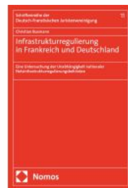
Infrastrukturregulierung in Frankreich und Deutschland Ladenpreis: 132,70EUR