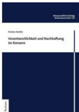
Verantwortlichkeit und Nachhaftung im Konzern Ladenpreis: 76,10EUR