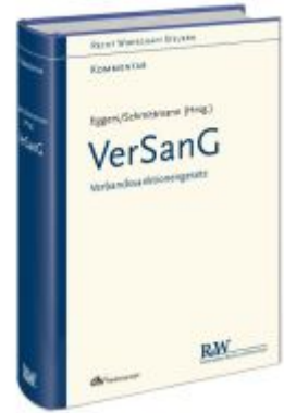
VerSanG - Verbandssanktionengesetz Ladenpreis: 173,80EUR