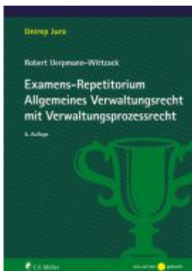
Examens-Repetitorium Allgemeines Verwaltungsrecht mit Verwaltungsprozessrecht Ladenpreis: 22,70EUR

Wir haben andere Produkte gefunden, die Ihnen gefallen könnten!