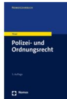
Polizei- und Ordnungsrecht Ladenpreis: 27,70EUR