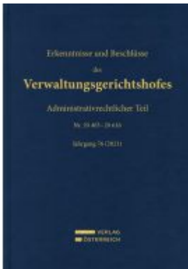
Erkenntnisse und Beschlüsse des Verwaltungsgerichtshofes Ladenpreis: 549,00EUR