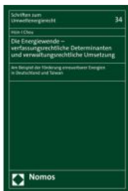
Die Energiewende – verfassungsrechtliche Determinanten und verwaltungsrechtliche Umsetzung Ladenpreis: 142,90EUR