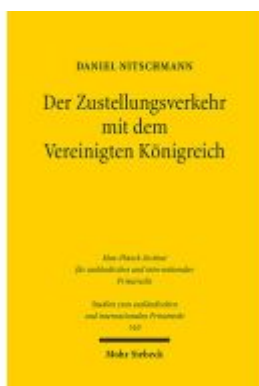
Der Zustellungsverkehr mit dem Vereinigten Königreich Ladenpreis: 91,50EUR