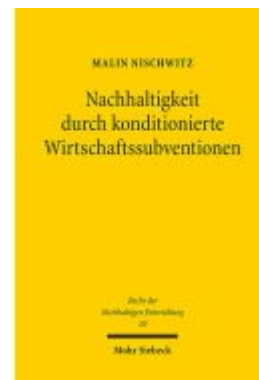
Nachhaltigkeit durch konditionierte Wirtschaftssubventionen Ladenpreis: 86,40EUR