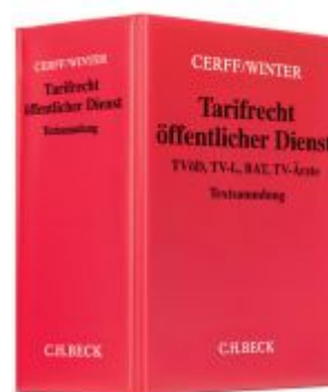
Tarifrecht öffentlicher Dienst Ladenpreis: 60,70EUR