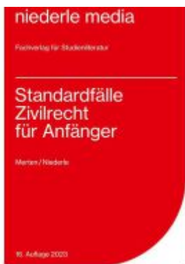
Standardfälle Zivilrecht für Anfänger - 2023 Ladenpreis: 12,30EUR