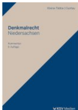
Denkmalrecht Niedersachsen Ladenpreis: 81,30EUR