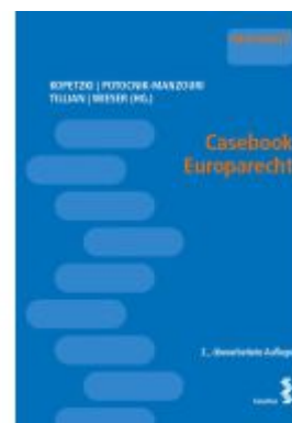
Casebook Europarecht Ladenpreis: 29,00EUR