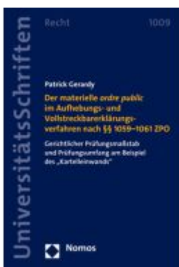
Der materielle ordre public im Aufhebungs- und Vollstreckbarerklärungsverfahren nach §§ 1059-1061 ZPO Ladenpreis: 101,80EUR