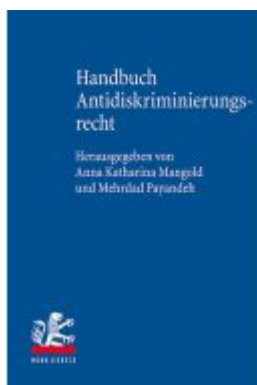
Handbuch Antidiskriminierungsrecht Ladenpreis: 132,70EUR