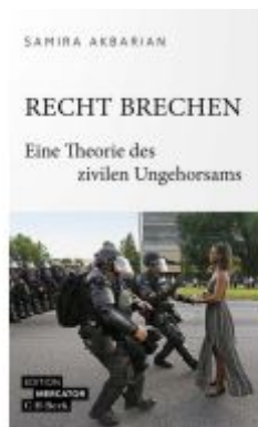
Recht brechen Ladenpreis: 16,50EUR