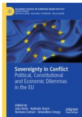
Sovereignty in Conflict Ladenpreis: 142,99EUR