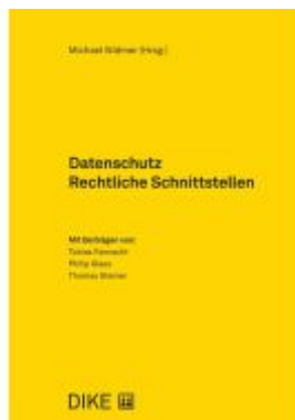
Datenschutz Rechtliche Schnittstellen Ladenpreis: 86,00EUR