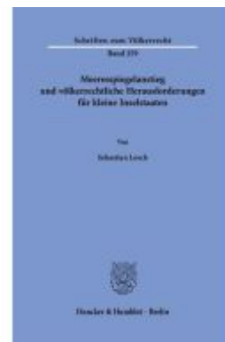
Meeresspiegelanstieg und völkerrechtliche Herausforderungen für kleine Inselstaaten. Ladenpreis: 102,70EUR