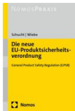
Die neue EU- Produktsicherheitsverordnung Ladenpreis: 50,40EUR