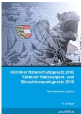
Kärntner Naturschutzgesetz 2002 / Kärntner Nationalpark- und Biosphärenparkgesetz 2019 Ladenpreis: 27,00EUR

Wir haben andere Produkte gefunden, die Ihnen gefallen könnten!