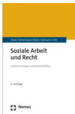
Soziale Arbeit und Recht Ladenpreis: 29,90EUR