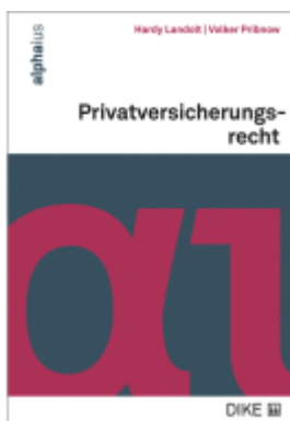
Privatversicherungsrecht Ladenpreis: 82,00EUR