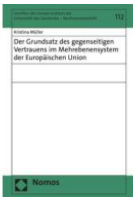
Der Grundsatz des gegenseitigen Vertrauens im Mehrebenensystem der Europäischen Union Ladenpreis: 256,00EUR