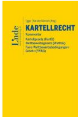
Kartellrecht Kommentar Ladenpreis: 290,00EUR