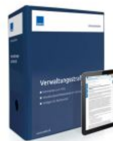
Verwaltungsstrafrecht Ladenpreis: 250,80EUR