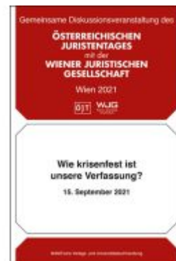
Wie krisenfest ist unsere Verfassung? Diskussionsveranstaltung vom 15. September 2021 Ladenpreis: 19,00EUR