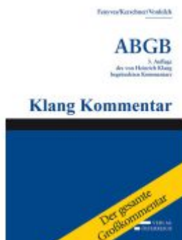
Großkommentar zum ABGB - Klang Kommentar Ladenpreis: 5.729,85EUR