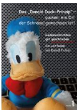
Das Donald Duck-Prinzip – quaken, wie Dir der Schnabel gewachsen ist! Ladenpreis: 13,40EUR