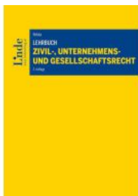
Lehrbuch Zivil-, Unternehmens- und Gesellschaftsrecht Ladenpreis: 55,00EUR