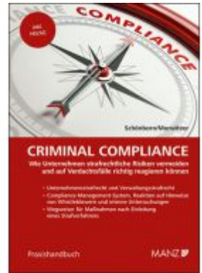
Criminal Compliance Ladenpreis: 128,00EUR