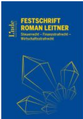
Festschrift Roman Leitner Ladenpreis: 138,00EUR