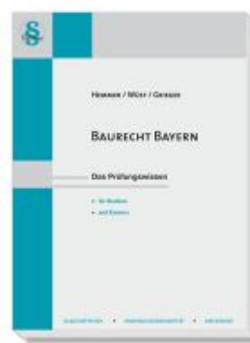
Baurecht Bayern Ladenpreis: 22,50EUR