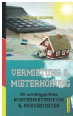
Vermietung & Mieterhöhung Ladenpreis: 29,90EUR