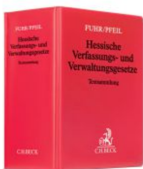
Hessische Verfassungs- und Verwaltungsgesetze Ladenpreis: 40,10EUR