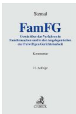
FamFG Ladenpreis: 173,80EUR