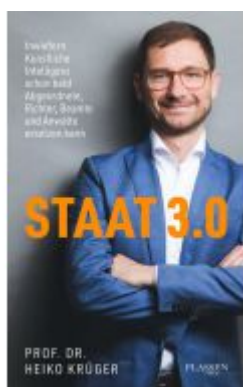
Staat 3.0 Ladenpreis: 23,50EUR