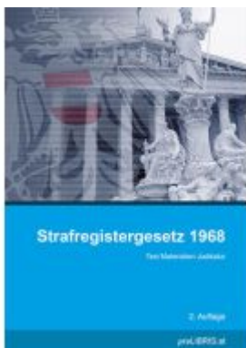
Strafregistergesetz 1968 Ladenpreis: 18,00EUR

Wir haben andere Produkte gefunden, die Ihnen gefallen könnten!