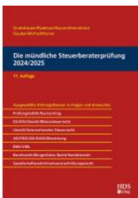
Die mündliche Steuerberaterprüfung 2024/2025 Ladenpreis: 61,60EUR