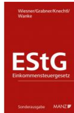
Einkommensteuergesetz EStG Ladenpreis: 398,00 EUR