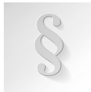
Eisenbahnrecht Ladenpreis: 128,00 EUR