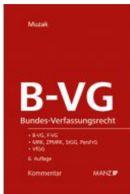
Bundes-Verfassungsrecht B-VG Ladenpreis: 194,00 EUR