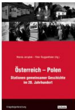
Österreich-Polen Ladenpreis: 30,00 EUR