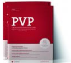
PVP Zeitschrift Ladenpreis: 0,00 EUR