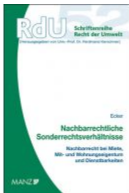
Nachbarrechtliche Sonderrechtsverhältnisse Ladenpreis: 54,00 EUR