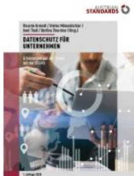
Datenschutz für Unternehmen Ladenpreis: 59,00 EUR