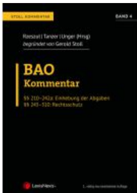
BAO Bundesabgabenordnung – Stoll Kommentar Band 4 Aktionspreis: 160,00 EUR Ladenpreis: 200,00 EUR

Wir haben andere Produkte gefunden, die Ihnen gefallen könnten!