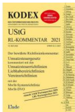
KODEX UStG-Richtlinien-Kommentar 2021 Ladenpreis: 53,00 EUR