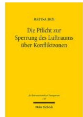
Die Pflicht zur Sperrung des Luftraums über Konfliktzonen Ladenpreis: 81,30EUR