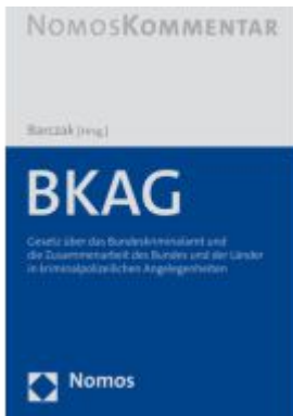
BKAG Ladenpreis: 184,10EUR

Wir haben andere Produkte gefunden, die Ihnen gefallen könnten!