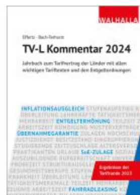
TV-L Kommentar 2024 Ladenpreis: 48,30EUR