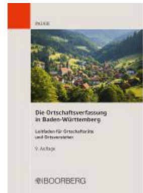
Die Ortschaftsverfassung in Baden- Württemberg Ladenpreis: 23,70EUR