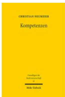
Kompetenzen Ladenpreis: 122,40EUR