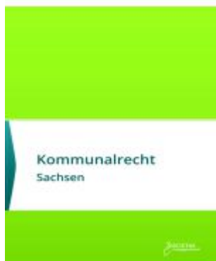
Kommunalrecht Sachsen Ladenpreis: 30,90EUR