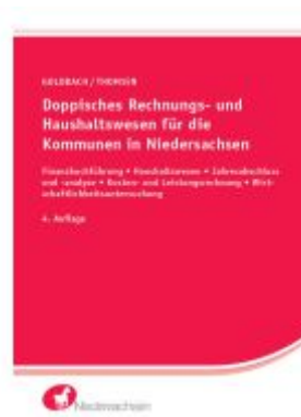
Doppisches Rechnungs- und Haushaltswesen für die Kommunen in Niedersachsen Ladenpreis: 46,30EUR