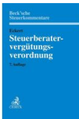
Steuerberatervergütungsverordnung Ladenpreis: 132,70EUR