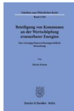
Beteiligung von Kommunen an der Wertschöpfung erneuerbarer Energien Ladenpreis: 41,10EUR