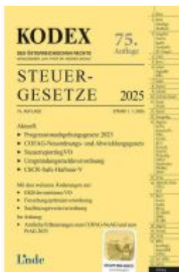
KODEX Steuergesetze 2025 Ladenpreis: 45,00EUR