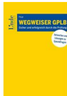
Wegweiser GPLB Ladenpreis: 38,00EUR