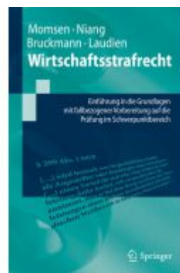
Wirtschaftsstrafrecht Ladenpreis: 30,83EUR