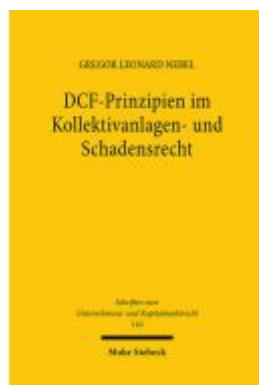
DCF-Prinzipien im Kollektivanlagen- und Schadensrecht Ladenpreis: 107,00EUR