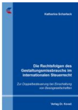
Die Rechtsfolgen des Gestaltungsmissbrauchs im internationalen Steuerrecht Ladenpreis: 91,40EUR