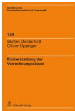
Rückerstattung der Verrechnungssteuer Ladenpreis: 175,20EUR

Wir haben andere Produkte gefunden, die Ihnen gefallen könnten!