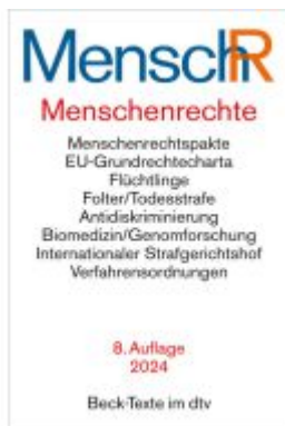
Menschenrechte - Ihr Internationaler Schutz Ladenpreis: 33,90EUR