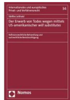
Der Erwerb von Todes wegen mittels US-amerikanischer will substitutes Ladenpreis: 214,90EUR