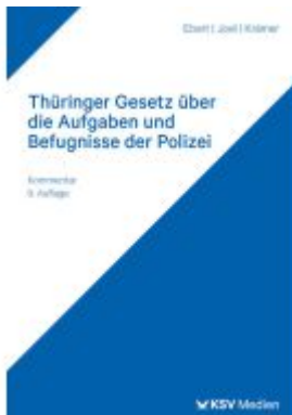
Thüringer Gesetz über die Aufgaben und Befugnisse der Polizei Ladenpreis: 81,30EUR