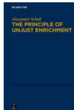
The Principle of Unjust Enrichment Ladenpreis: 99,95EUR