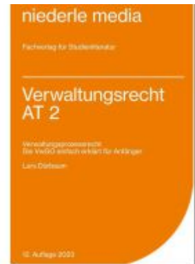
Verwaltungsrecht AT 2 - VwGO - 2023 Ladenpreis: 12,30EUR