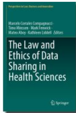
The Law and Ethics of Data Sharing in Health Sciences Ladenpreis: 164,99EUR