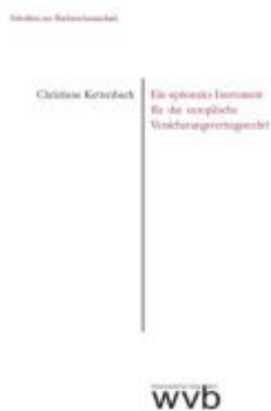
Ein optionales Instrument für das europäische Versicherungsvertragsrecht? Ladenpreis: 40,10EUR