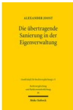
Die übertragende Sanierung in der Eigenverwaltung Ladenpreis: 86,40EUR