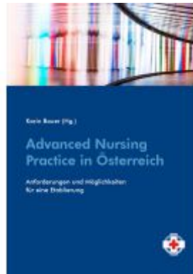
Advanced Nursing Practice in Österreich Ladenpreis: 14,90 EUR