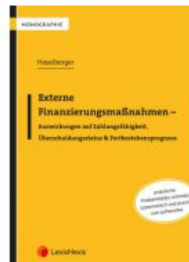
Externe Finanzierungsmaßnahmen - Auswirkungen auf Zahlungsfähigkeit, Überschuldungsstatus & Fortbestehensprognose Ladenpreis: 46,00 EUR