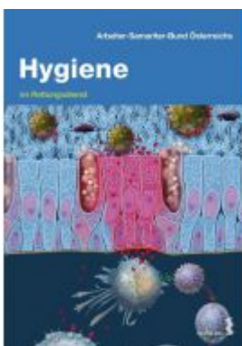
Hygiene im Rettungsdienst Ladenpreis: 18,60 EUR