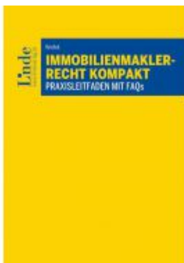
Immobilienmaklerrecht kompakt Ladenpreis: 39,00 EUR

Wir haben andere Produkte gefunden, die Ihnen gefallen könnten!