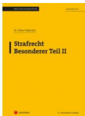
Strafrecht - Besonderer Teil II (Skriptum) Ladenpreis: 19,00 EUR