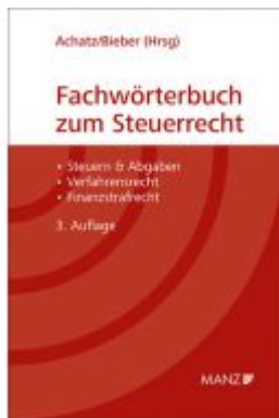
Fachwörterbuch zum Steuerrecht Ladenpreis: 81,00 EUR