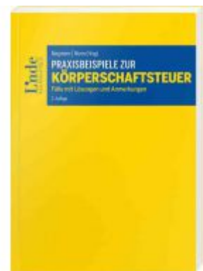
Praxisbeispiele zur Körperschaftsteuer Ladenpreis: 45,00 EUR