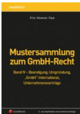
Mustersammlung zum GmbH-Recht / Mustersammlung zum GmbH-Recht, Band IV - Beendigung, Umgründung, "GmbH" international, Unternehmensverträge Ladenpreis: 299,00 EUR