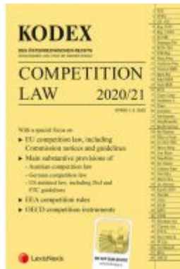
KODEX Competition Law Ladenpreis: 46,00 EUR