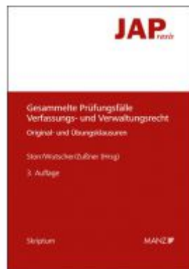
Gesammelte Prüfungsfälle Verfassungs- und Verwaltungsrecht Ladenpreis: 33,00 EUR