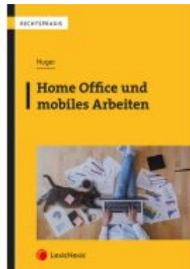
Home Office und mobiles Arbeiten Ladenpreis: 32,00 EUR