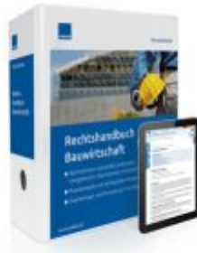
Rechtshandbuch Bauwirtschaft Ladenpreis: 217,80 EUR