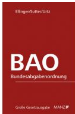
Bundesabgabenordnung - BAO Ladenpreis: 348,00 EUR