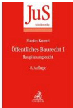
Öffentliches Baurecht I: Bauplanungsrecht