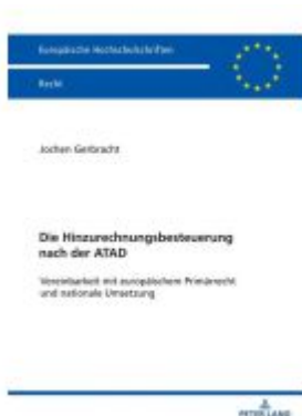
Die Hinzurechnungsbesteuerung nach der ATAD

Wir haben andere Produkte gefunden, die Ihnen gefallen könnten!