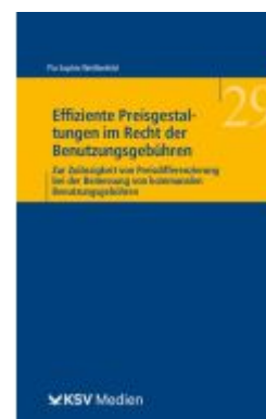
Effiziente Preisgestaltungen im Recht der Benutzungsgebühren Ladenpreis: 40,10EUR