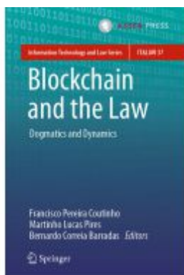
Blockchain and the Law