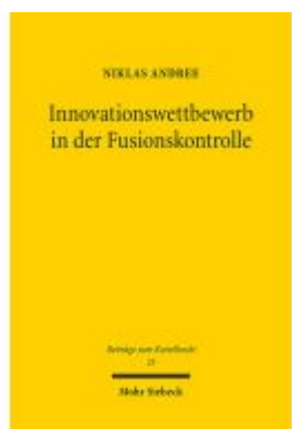
Innovationswettbewerb in der Fusionskontrolle Ladenpreis: 101,80EUR