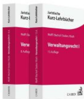
Verwaltungsrecht Gesamtwerk Ladenpreis: 112,10EUR