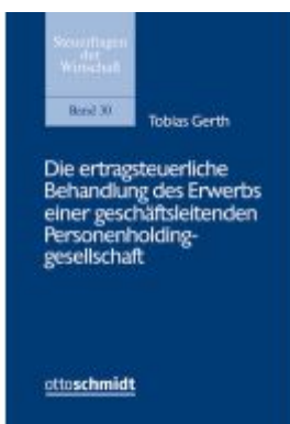
Die ertragsteuerliche Behandlung des Erwerbs einer geschäftsleitenden Personenholdinggesellschaft Ladenpreis: 101,80EUR