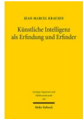
Künstliche Intelligenz als Erfindung und Erfinder Ladenpreis: 91,50EUR