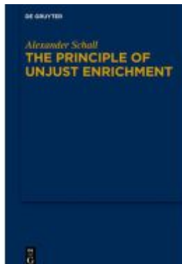
The Principle of Unjust Enrichment Ladenpreis: 99,95EUR