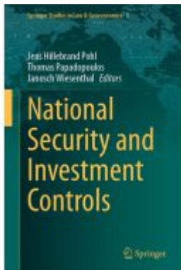
National Security and Investment Controls Ladenpreis: 186,99EUR

Wir haben andere Produkte gefunden, die Ihnen gefallen könnten!