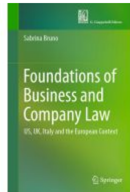
Foundations of Business and Company Law Ladenpreis: 109,99EUR