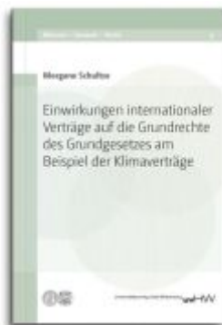
Einwirkungen internationaler Verträge auf die Grundrechte des Grundgesetzes am Beispiel der Klimaverträge Ladenpreis: 59,70EUR