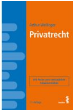
Privatrecht Ladenpreis: 48,00EUR