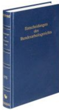
Entscheidungen des Bundesarbeitsgerichts (BAGE 175) Ladenpreis: 100,80EUR