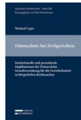
Datenschutz bei den Zivilgerichten Ladenpreis: 77,00EUR