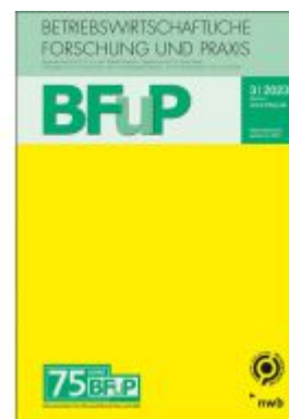
Betriebswirtschaftliche Steuerlehre Ladenpreis: 40,30EUR