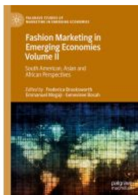
Fashion Marketing in Emerging Economies Volume II Ladenpreis: 175,99EUR