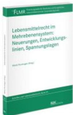
Lebensmittelrecht im Mehrebenensystem: Neuerungen, Entwicklungslinien, Spannungslagen Ladenpreis: 71,00EUR

Wir haben andere Produkte gefunden, die Ihnen gefallen könnten!