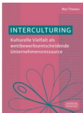
Interculturing Ladenpreis: 51,40EUR