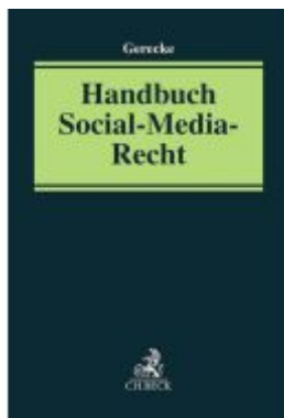
Handbuch Social-Media-Recht Ladenpreis: 112,10EUR