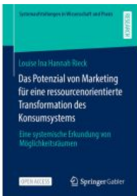
Das Potenzial von Marketing für eine ressourcenorientierte Transformation des Konsumsystems Ladenpreis: 43,99EUR