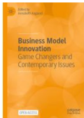
Business Model Innovation Ladenpreis: 43,99EUR