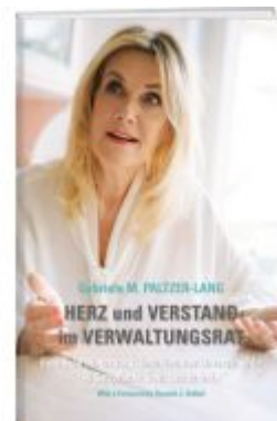
Herz und Verstand im Verwaltungsrat Ladenpreis: 49,00EUR