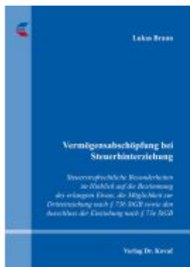
Vermögensabschöpfung bei Steuerhinterziehung Ladenpreis: 98,50EUR