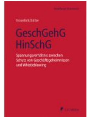
GeschGehG/HinSchG Ladenpreis: 163,50EUR