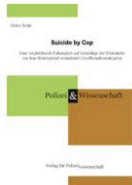
Suicide by Cop Ladenpreis: 41,10EUR