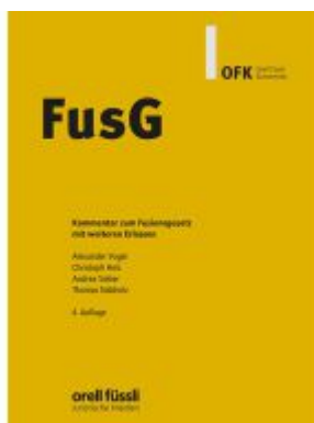
FusG Kommentar Ladenpreis: 203,60EUR