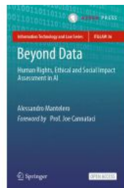
Beyond Data Ladenpreis: 43,99EUR