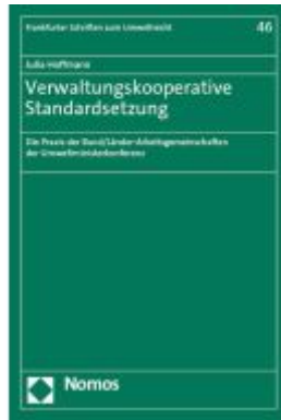
Verwaltungskooperative Standardsetzung Ladenpreis: 96,70EUR