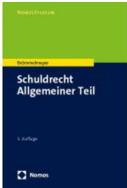
Schuldrecht Allgemeiner Teil Ladenpreis: 27,70EUR