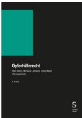
Opferhilferecht Ladenpreis: 352,70EUR