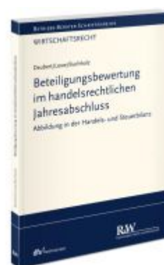
Beteiligungsbewertung im handelsrechtlichen Jahresabschluss Ladenpreis: 91,50EUR