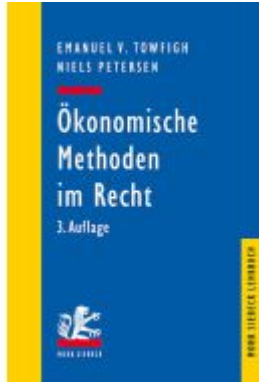
Ökonomische Methoden im Recht Ladenpreis: 29,90EUR