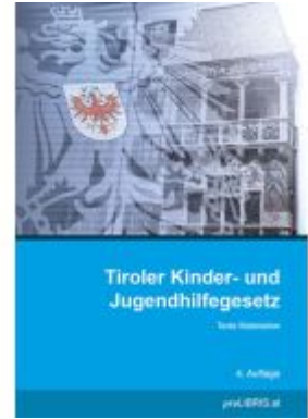
Tiroler Kinder- und Jugendhilfegesetz Ladenpreis: 23,00EUR