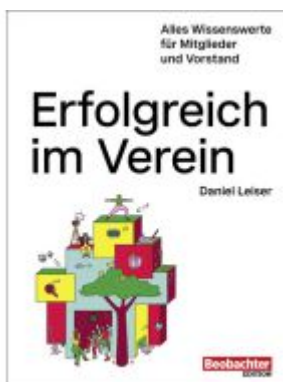
Erfolgreich im Verein Ladenpreis: 40,10EUR