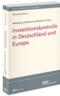
Investitionskontrolle in Deutschland und Europa Ladenpreis: 173,80EUR