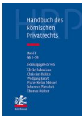
Handbuch des Römischen Privatrechts Ladenpreis: 646,70EUR