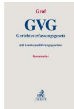
Gerichtsverfassungsgesetz Ladenpreis: 256,00EUR