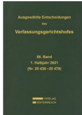
Ausgewählte Entscheidungen des Verfassungsgerichtshofes Ladenpreis: 419,00EUR