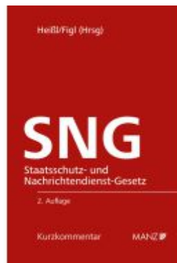
Staatsschutz- und Nachrichtendienst-Gesetz SNG Ladenpreis: 84,00EUR