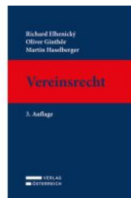
Vereinsrecht Ladenpreis: 98,00EUR