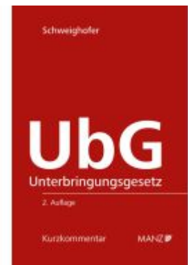
Unterbringungsgesetz - UbG Ladenpreis: 46,00EUR