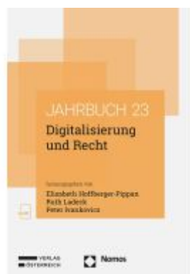
Digitalisierung und Recht Ladenpreis: 98,00EUR