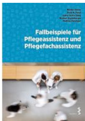
Fallbeispiele für Pflegeassistenten und Pflegefachassistenten Ladenpreis: 24,90EUR