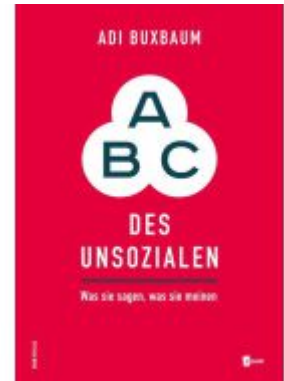
ABC des Unsozialen Ladenpreis: 24,90EUR