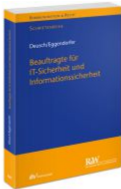
Beauftragte für IT-Sicherheit und Informationssicherheit Ladenpreis: 71,00EUR