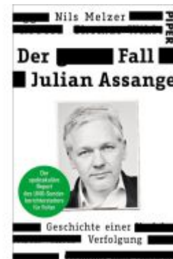
Der Fall Julian Assange Ladenpreis: 14,40EUR