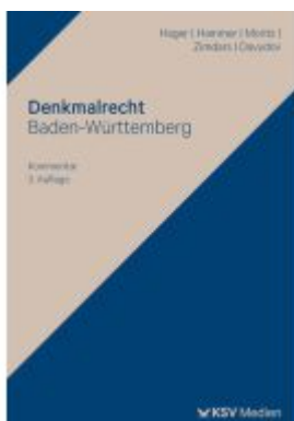
Denkmalrecht Baden-Württemberg Ladenpreis: 71,00EUR