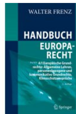
Handbuch Europarecht Ladenpreis: 154,20EUR