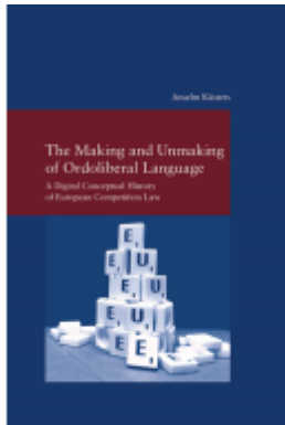
The Making and Unmaking of Ordoliberal Language Ladenpreis: 122,40EUR