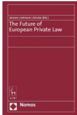
The Future of European Private Law Ladenpreis: 163,50EUR