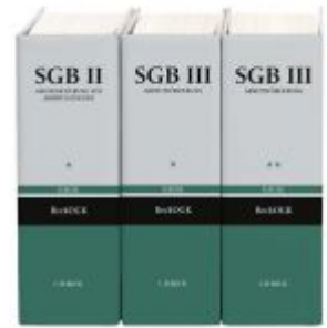
beck-online.GROSSKOMMENTAR zum SGB: SGB II / SGB III (Gagel) Ladenpreis: 410,20EUR