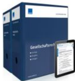
Mustersammlung Gesellschaftsrecht Ladenpreis: 264,00EUR