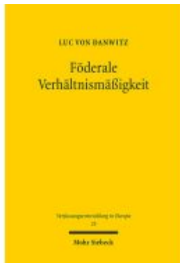
Föderale Verhältnismäßigkeit Ladenpreis: 96,70EUR

Wir haben andere Produkte gefunden, die Ihnen gefallen könnten!