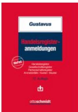
Handelsregisteranmeldungen Ladenpreis: 66,70EUR