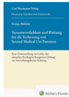
Verantwortlichkeit und Haftung für die Verletzung von Second Medical Use Patenten Ladenpreis: 81,30EUR