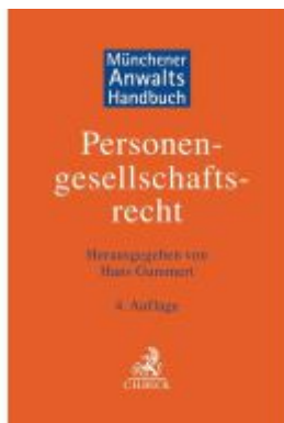
Münchener AnwaltsHandbuch Personengesellschaftsrecht Ladenpreis: 204,60EUR