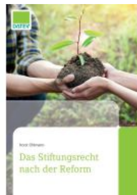
Das Stiftungsrecht nach der Reform Ladenpreis: 28,84EUR