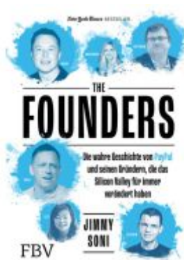
The Founders Ladenpreis: 22,70EUR