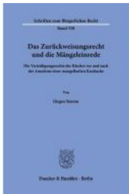
Das Zurückweisungsrecht und die Mängelrede. Ladenpreis: 51,30EUR

Wir haben andere Produkte gefunden, die Ihnen gefallen könnten!