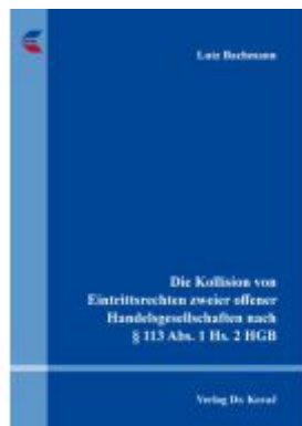
Die Kollision von Eintrittsrechten zweier offener Handelsgesellschaften nach § 113 Abs. 1 Hs. 2 HGB Ladenpreis: 91,40EUR