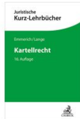
Kartellrecht Ladenpreis: 51,20EUR