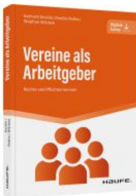
Vereine als Arbeitgeber Ladenpreis: 30,80EUR