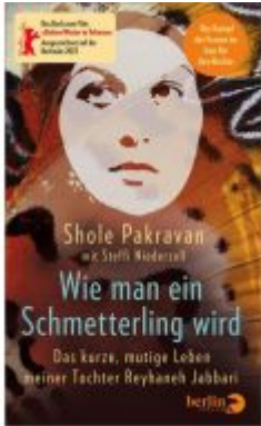
Wie man ein Schmetterling wird Ladenpreis: 24,70EUR