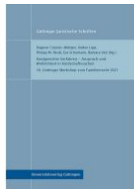
Kindgerechte Verfahren – Anspruch und Wirklichkeit in Kindschaftssachen Ladenpreis: 25,70EUR