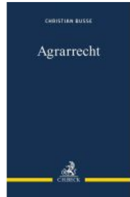
Agrarrecht Ladenpreis: 29,90EUR