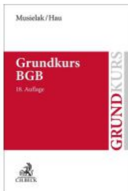
Grundkurs BGB Ladenpreis: 27,70EUR