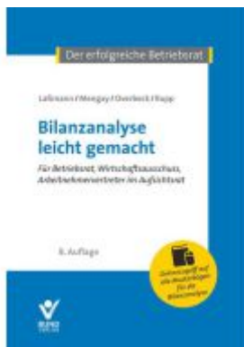
Bilanzanalyse leicht gemacht Ladenpreis: 43,20EUR