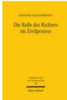
Die Rolle des Richters im Zivilprozess Ladenpreis: 132,70EUR