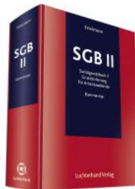
Kommentar zum SGB II Ladenpreis: 132,70EUR