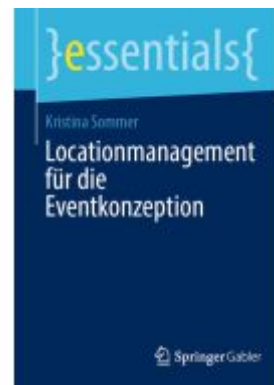
Locationmanagement für die Eventkonzeption Ladenpreis: 15,41EUR