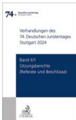
Verhandlungen des 74. Deutschen Juristentages Stuttgart 2024 Band II/1: Sitzungsberichte - Referate und Beschlüsse Ladenpreis: 173,80EUR