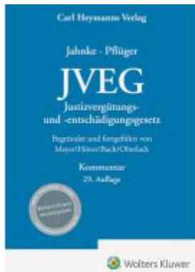
JVEG Ladenpreis: 101,80EUR