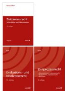
PAKET: Zivilprozessrecht 4.Auflage+ Zivilprozessrecht Schaubilder und Aktenmuster 14.Auflage+ Exekutions-und InsolvenzR 12.Auflage Ladenpreis: 124,20EUR