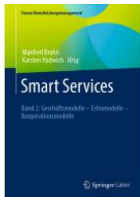
Smart Services Ladenpreis: 174,76EUR