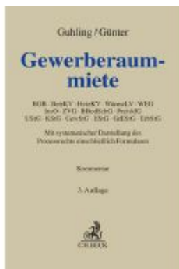
Gewerberaum-miete Ladenpreis: 256,00EUR