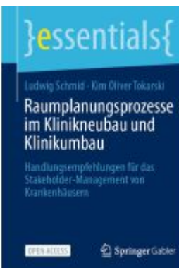
Raumplanungsprozesse im Klinikneubau und Klinikumbau Ladenpreis: 16,49EUR