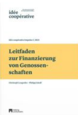
Leitfaden zur Finanzierung von Genossenschaften Ladenpreis: 42,00EUR