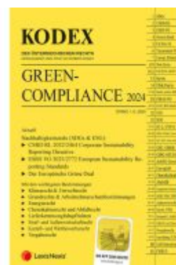
KODEX Green Compliance 2024 - inkl. App Ladenpreis: 92,00EUR