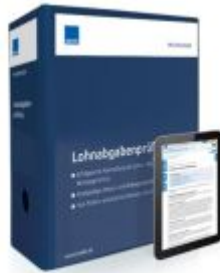
Lohnabgabenprüfung Ladenpreis: 250,80EUR