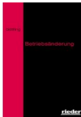
Betriebsänderung Ladenpreis: 25,70EUR