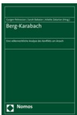
Berg-Karabach Ladenpreis: 127,50EUR