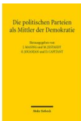
Die politischen Parteien als Mittler der Demokratie Ladenpreis: 81,30EUR