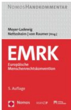
EMRK Europäische Menschenrechtskonvention Ladenpreis: 142,90EUR

Wir haben andere Produkte gefunden, die Ihnen gefallen könnten!