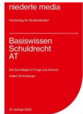
Basiswissen Schuldrecht AT - 2022 Ladenpreis: 8,20EUR