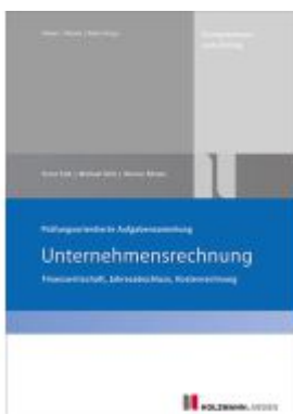
Prüfungsorientierte Aufgabensammlung "Unternehmensrechnung" Ladenpreis: 20,50EUR