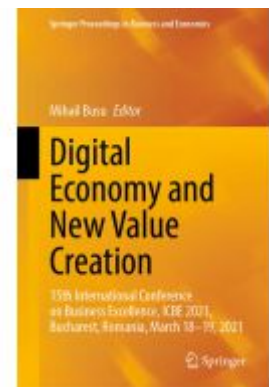
Digital Economy and New Value Creation Ladenpreis: 219,99EUR