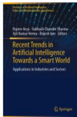
Recent Trends in Artificial Intelligence Towards a Smart World Ladenpreis: 186,99EUR