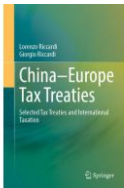
China-Europe Tax Treaties Ladenpreis: 197,99EUR