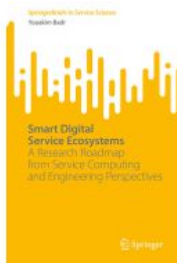
Smart Digital Service Ecosystems Ladenpreis: 54,99EUR