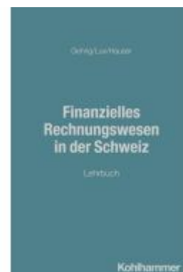
Finanzielles Rechnungswesen in der Schweiz Ladenpreis: 50,40EUR