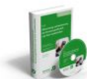
Bilanzierung und Besteuerung der Personengesellschaft und Ihrer Gesellschafter Ladenpreis: 217,80EUR