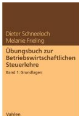
Übungsbuch zur Betriebswirtschaftlichen Steuerlehre Band 1: Grundlagen Ladenpreis: 23,60EUR