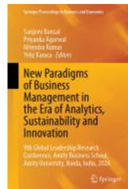
New Paradigms of Business Management in the Era of Analytics, Sustainability and Innovation Ladenpreis: 219,99EUR