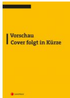
Arbeitsrecht graphisch dargestellt Ladenpreis: 21,00 EUR