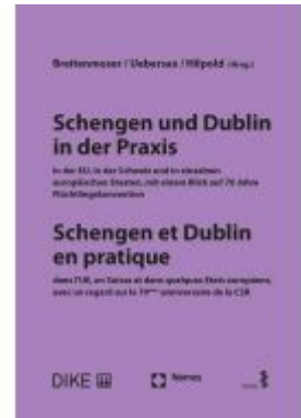
Schengen und Dublin in der Praxis Ladenpreis: 80,20EUR