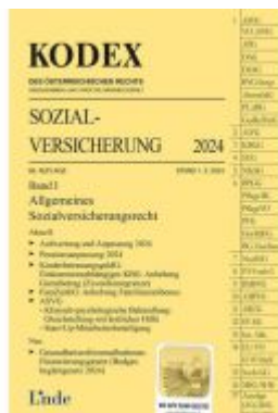
KODEX Sozialversicherung 2024, Band I Ladenpreis: 46,00EUR

Wir haben andere Produkte gefunden, die Ihnen gefallen könnten!