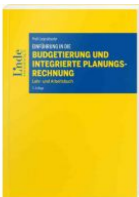
Einführung in die Budgetierung und integrierte Planungsrechnung Ladenpreis: 36,00 EUR