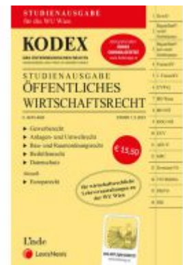
KODEX Öffentliches Wirtschaftsrecht 2021 Ladenpreis: 15,50 EUR