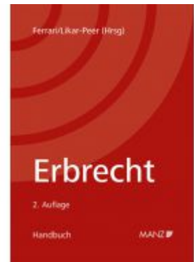
Erbrecht Ladenpreis: 160,00 EUR