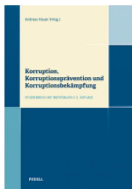
Korruption, Korruptionsprävention und Korruptionsbekämpfung Ladenpreis: 38,00 EUR