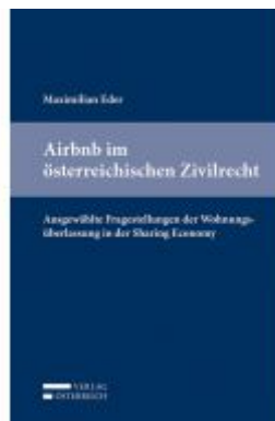
Airbnb im österreichischen Zivilrecht Ladenpreis: 53,00 EUR