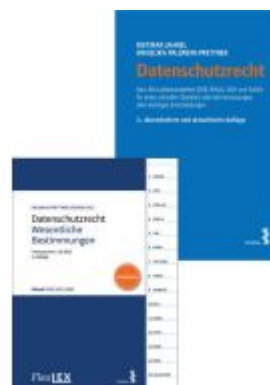
Kombipaket Datenschutzrecht und FlexLex Datenschutzrecht – Wesentliche Bestimmungen Ladenpreis: 38,00EUR

Alle Preise inkl. MwSt. zzgl. Versand. Bei Bestellung im LexisNexis Onlineshop kostenloser Versand innerhalb Österreichs.