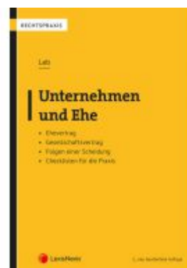
Unternehmen und Ehe Ladenpreis: 39,00 EUR