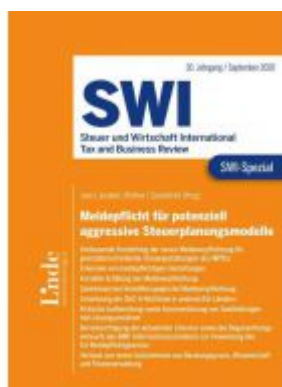
SWI-Spezial Meldepflicht für potenziell aggressive Steuerplanungsmodelle Ladenpreis: 58,00 EUR