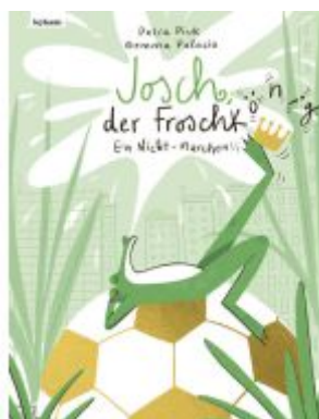
Josch der Froschkönig – Ein Nicht-Märchen Ladenpreis: 18,50EUR