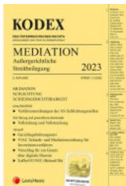
KODEX Mediation 2023 Ladenpreis: 32,00EUR