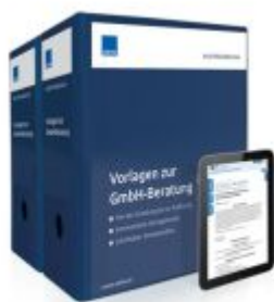
Vorlagen zur GmbH-Beratung Ladenpreis: 250,80EUR