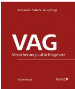
VAG - Versicherungsaufsichtsgesetz Ladenpreis: 348,00EUR