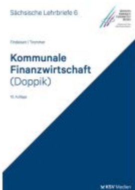
Kommunale Finanzwirtschaft (Doppik) (SL) 6) Ladenpreis: 25,70EUR

Wir haben andere Produkte gefunden, die Ihnen gefallen könnten!