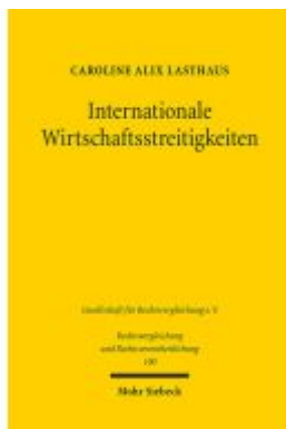
Internationale Wirtschaftsstreitigkeiten Ladenpreis: 96,70EUR