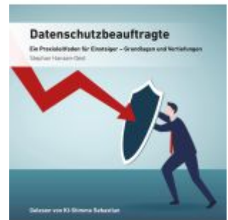
Datenschutzbeauftragte Ladenpreis: 40,10EUR