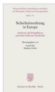
Sicherheitsordnung in Europa. Ladenpreis: 71,90EUR