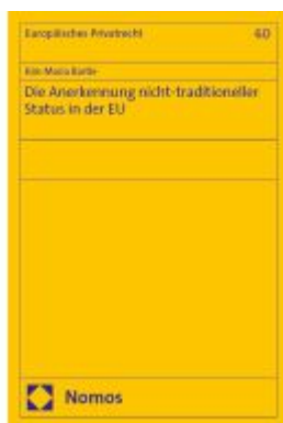
Die Anerkennung nicht-traditioneller Status in der EU Ladenpreis: 163,50EUR