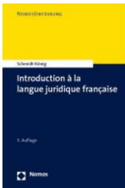
Introduction à la langue juridique française Ladenpreis: 30,80EUR