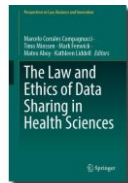
The Law and Ethics of Data Sharing in Health Sciences Ladenpreis: 164,99EUR