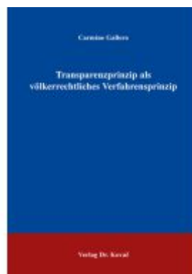
Transparenzprinzip als völkerrechtliches Verfahrensprinzip Ladenpreis: 102,60EUR