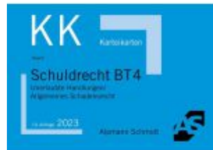
Kartekarten Schuldrecht BT 4 Ladenpreis: 14,30EUR