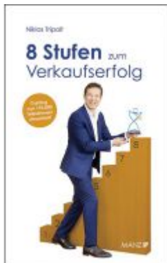
8 Stufen zum Verkaufserfolg Ladenpreis: 21,80 EUR

Wir haben andere Produkte gefunden, die Ihnen gefallen könnten!