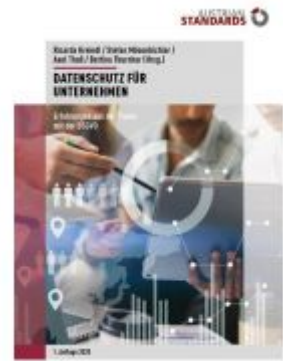
Datenschutz für Unternehmen Ladenpreis: 59,00 EUR