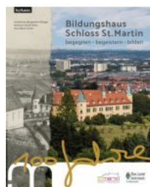
Bildungshaus Schloss St. Martin - 100 Jahre - begegnen - begeistern - bilden Ladenpreis: 25,00 EUR