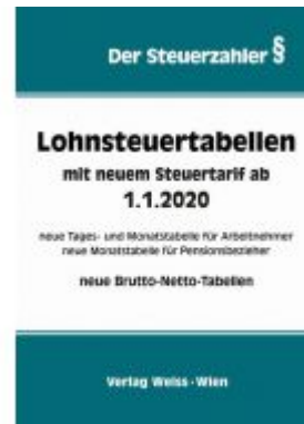
Lohnsteuertabellen mit neuem Steuertarif ab 1.1.2020 Ladenpreis: 34,10 EUR