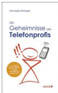
Die Geheimnisse des Telefonprofis Ladenpreis: 21,90 EUR