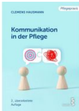
Kommunikation in der Pflege Ladenpreis: 16,90 EUR