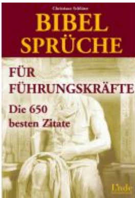
Bibelsprüche für Führungskräfte Ladenpreis: 18,50 EUR