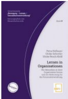
Lernen in Organisationen Ladenpreis: 28,80 EUR