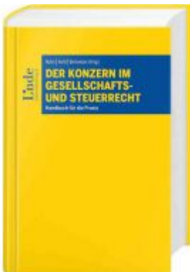
Der Konzern im Gesellschafts- und Steuerrecht Ladenpreis: 185,00 EUR