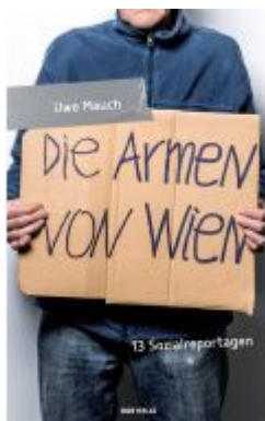
Die Armen von Wien Ladenpreis: 19,90 EUR