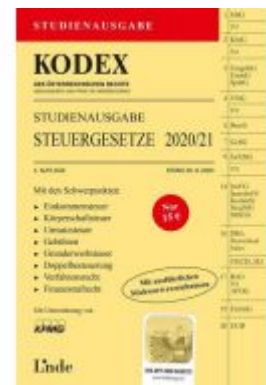
KODEX Studienausgabe Steuergesetze 2020/21 Ladenpreis: 15,00 EUR