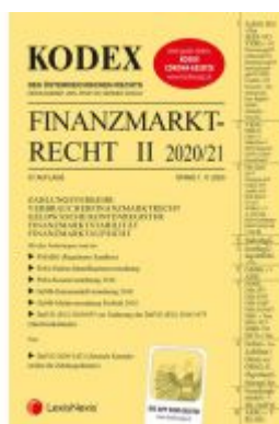
KODEX Finanzmarktrecht Band II 2020/21 Ladenpreis: 81,00 EUR