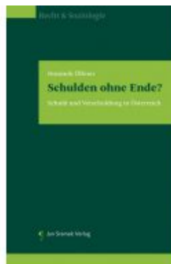
Schulden ohne Ende? Ladenpreis: 85,00 EUR