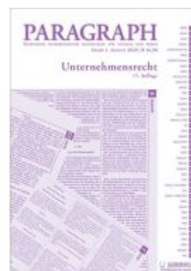
Paragraph - Unternehmensrecht Ladenpreis: 16,90 EUR