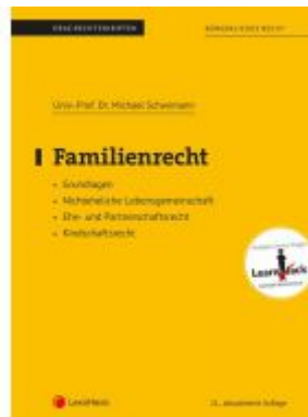
Familienrecht (Skriptum) Ladenpreis: 19,00 EUR