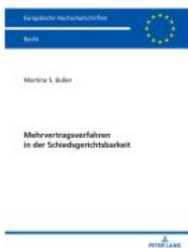
Mehrvertragsverfahren in der Schiedsgerichtsbarkeit Ladenpreis: 56,50EUR