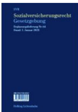
Sozialversicherungsrecht - Gesetzgebung EL 64 Ladenpreis: 66,00EUR