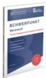
SCHWERPUNKT Steuerrecht Ladenpreis: 28,70EUR