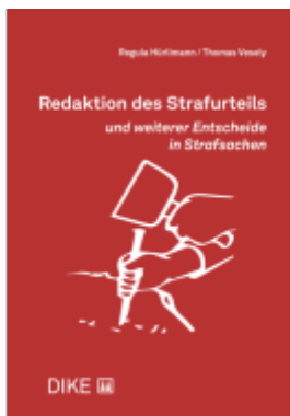
Redaktion des Strafurteils und weiterer Entscheide in Strafsachen Ladenpreis: 102,00EUR