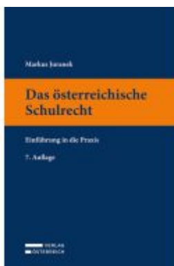
Das österreichische Schulrecht Ladenpreis: 54,00EUR