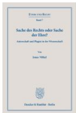
Sache des Rechts oder Sache der Ehre? Ladenpreis: 71,90EUR