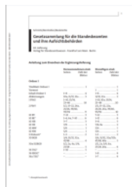
Gesetzsammlung für die Landesbeamten und ihre Aufsichtsbehörden Ladenpreis: 94,20EUR