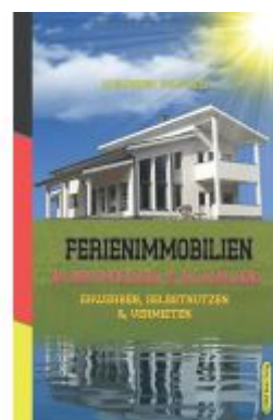
Ferienimmobilien in Deutschland & im Ausland Ladenpreis: 29,90EUR