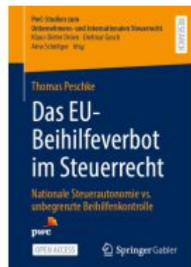
Das EU-Beihilfeverbot im Steuerrecht Ladenpreis: 43,99EUR