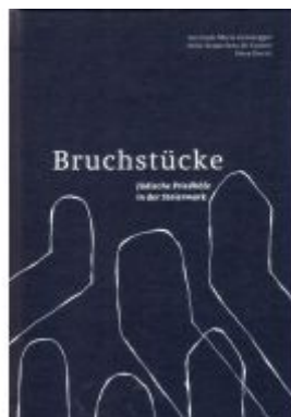
Bruchstücke Ladenpreis: 24,90 EUR