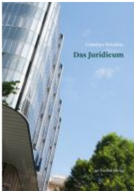
Das Juridicum Ladenpreis: 49,90 EUR