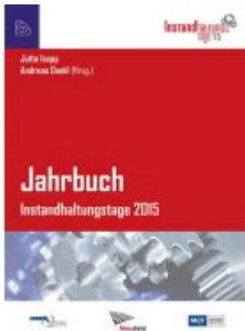
Jahrbuch Instandhaltungstage 2015 Ladenpreis: 54,90 EUR