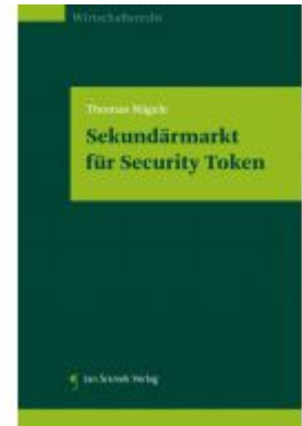
Sekundärmarkt für Security Token Ladenpreis: 29,90 EUR