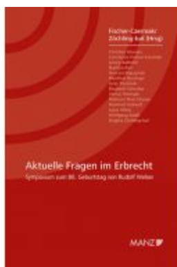
Aktuelle Fragen im Erbrecht Symposium zum 80. Geburtstag von Rudolf Weiser Ladenpreis: 34,80 EUR