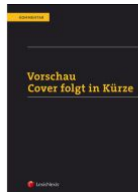
ABGB Taschenkommentar Aktionspreis: 249,00 EUR Ladenpreis: 319,00 EUR