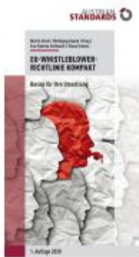
EU-Whistleblower-Richtlinie kompakt Ladenpreis: 29,70 EUR