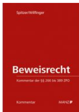
Beweisrecht Ladenpreis: 74,00 EUR