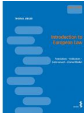
Introduction to European Law Ladenpreis: 22,00 EUR