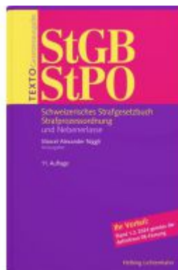
TEXTO StGB/StPO Ladenpreis: 28,00EUR