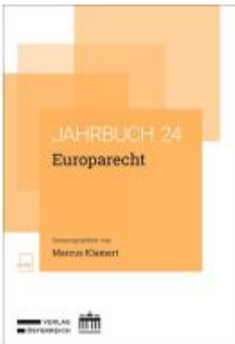
Jahrbuch Europarecht 2024 Ladenpreis: 86,40EUR