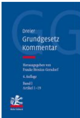
Grundgesetz-Kommentar Ladenpreis: 276,60EUR

Wir haben andere Produkte gefunden, die Ihnen gefallen könnten!