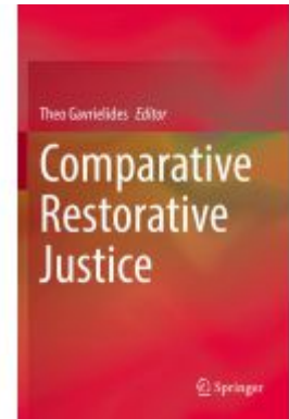
Comparative Restorative Justice Ladenpreis: 164,99EUR