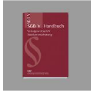
SGB V Handbuch Ladenpreis: 63,70EUR