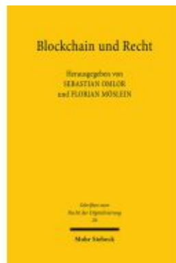
Blockchain und Recht Ladenpreis: 117,20EUR