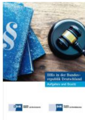
IHKs in der Bundesrepublik Deutschland Ladenpreis: 8,30EUR