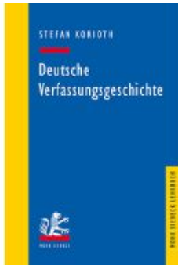
Deutsche Verfassungsgeschichte Ladenpreis: 29,90EUR