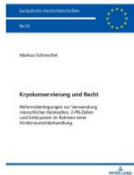
Kryokonservierung und Recht Ladenpreis: 77,10EUR