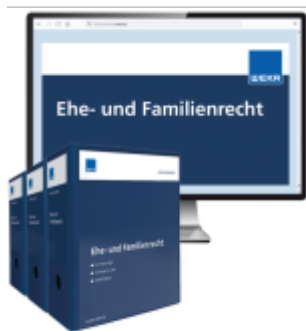
Ehe- und Familienrecht Ladenpreis: 283,80EUR