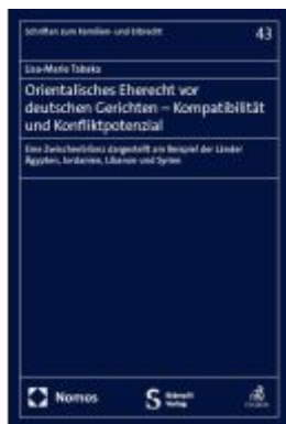
Orientalisches Eherecht vor deutschen Gerichten – Kompatibilität und Konfliktpotenzial Ladenpreis: 142,90EUR