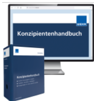
Konzipientenhandbuch Ladenpreis: 250,80EUR