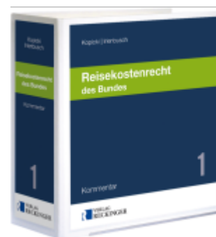
Reisekostenrecht des Bundes Ladenpreis: 142,90EUR