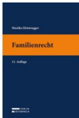
Familienrecht Ladenpreis: 35,00EUR

Wir haben andere Produkte gefunden, die Ihnen gefallen könnten!