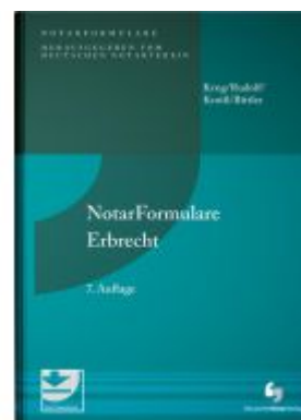
NotarFormulare Erbrecht Ladenpreis: 153,20EUR