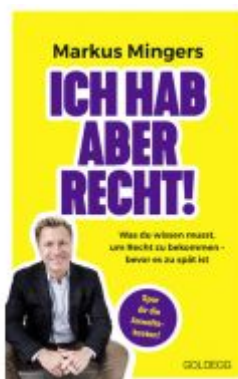
Ich hab aber recht! Was du wissen musst, um recht zu bekommen – bevor es zu spät ist. Häufige Rechtsirrtümer und praktisches Wissen zu Rechten im Alltag vom Spitzenanwalt erklärt Ladenpreis: 19,00EUR