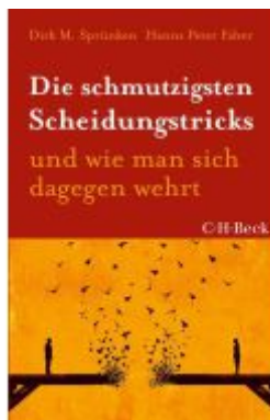
Die schmutzigsten Scheidungstricks Ladenpreis: 12,40EUR