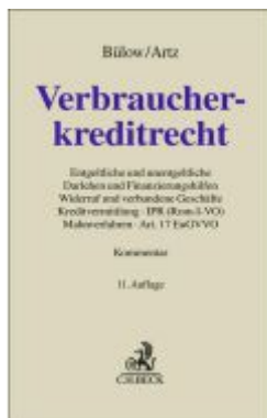
Verbraucherkreditrecht Ladenpreis: 180,00EUR