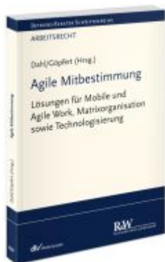
Agile Mitbestimmung Ladenpreis: 71,00EUR