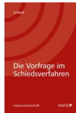
Die Vorfrage im Schiedsverfahren Ladenpreis: 48,00EUR