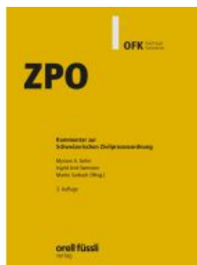
ZPO Ladenpreis: 172,80EUR