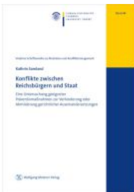
Konflikte zwischen Reichsbürgern und Staat Ladenpreis: 20,50EUR