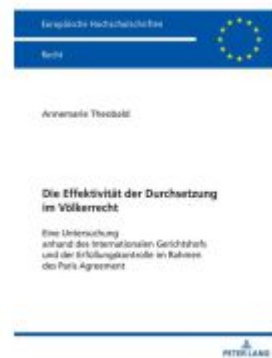
Die Effektivität der Durchsetzung im Völkerrecht Ladenpreis: 63,70EUR