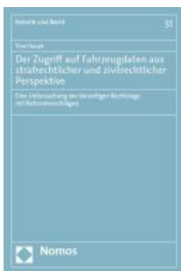
Der Zugriff auf Fahrzeugdaten aus strafrechtlicher und zivilrechtlicher Perspektive Ladenpreis: 112,10EUR