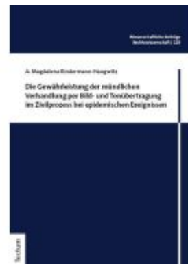
Die Gewährleistung der mündlichen Verhandlung per Bild- und Tonübertragung im Zivilprozess bei epidemischen Ereignissen Ladenpreis: 65,80EUR