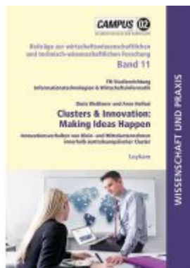
Clusters & Innovation: Making Ideas Happen Ladenpreis: 14,90 EUR