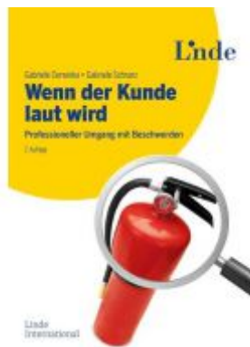
Wenn der Kunde laut wird Ladenpreis: 24,90 EUR