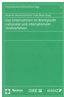
Das Unternehmen im Brennpunkt nationaler und internationaler Strafverfahren Ladenpreis: 64,00 EUR