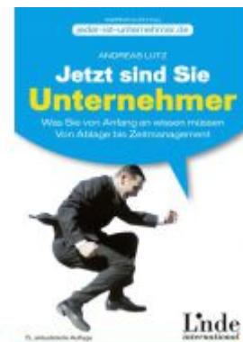
Jetzt sind Sie Unternehmer Ladenpreis: 19,90 EUR