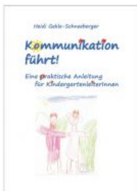
Kommunikation führt! Ladenpreis: 19,90 EUR