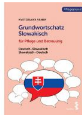
Grundwortschatz Slowakisch für Pflege- und Gesundheitsberufe Ladenpreis: 18,90 EUR