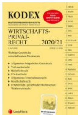
KODEX Wirtschaftsprivatrecht 2020/21 Ladenpreis: 29,80 EUR

Wir haben andere Produkte gefunden, die Ihnen gefallen könnten!