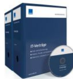
Mustersammlung IT-Verträge Ladenpreis: 207,90 EUR