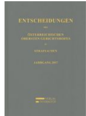
Entscheidungen des Österreichischen Obersten Gerichtshofes in Strafsachen Ladenpreis: 179,00 EUR