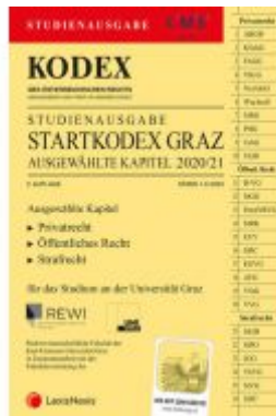
KODEX Startkodex Graz 2020/21 Ladenpreis: 19,00 EUR