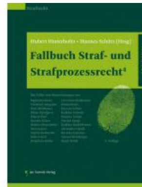
Fallbuch Straf- und Strafprozessrecht 4 Ladenpreis: 42,50 EUR