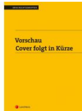
Finanzstrafrecht (Skriptum) Ladenpreis: 23,00 EUR