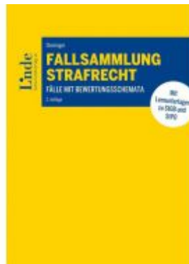
Fallsammlung Strafrecht Ladenpreis: 42,00 EUR