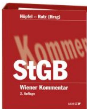
Wiener Kommentar zum Strafgesetzbuch 2. Auflage Ladenpreis: 564,00 EUR