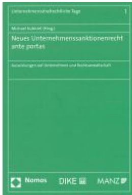
Neues Unternehmenssanktionenrecht ante portas Ladenpreis: 49,00 EUR