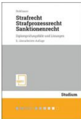
Strafrecht, Strafprozessrecht, Sanktionenrecht Ladenpreis: 32,00 EUR