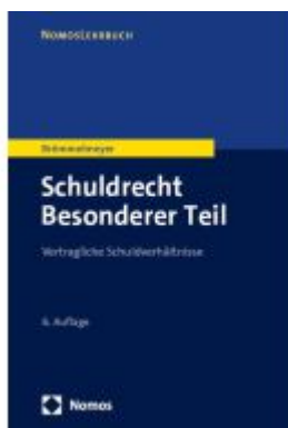
Schuldrecht Besonderer Teil Ladenpreis: 27,70EUR