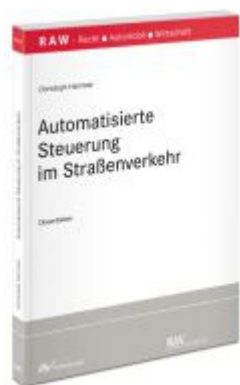
Hochautomatisiertes Fahren in Deutschland und Kalifornien Ladenpreis: 91,50EUR