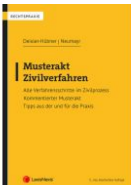
Musterakt Zivilverfahren Ladenpreis: 66,25EUR

Wir haben andere Produkte gefunden, die Ihnen gefallen könnten!