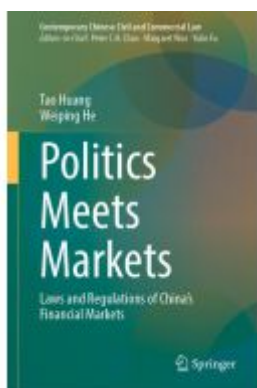
Politics Meets Markets Ladenpreis: 142,99EUR