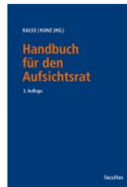
Handbuch für den Aufsichtsrat Ladenpreis: 280,00EUR