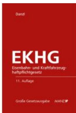
Eisenbahn- und Kraftfahrzeughaftpflichtgesetz EKHG Ladenpreis: 158,00EUR