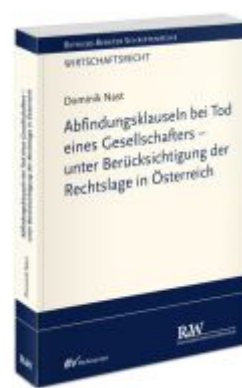
Abfindungsklauseln bei Tod eines Gesellschafters - unter Berücksichtigung der Rechtslage in Österreich Ladenpreis: 91,50EUR