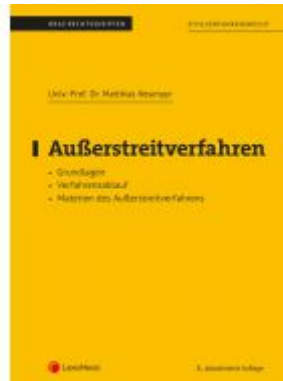
Außerstreitverfahren (Skriptum) Ladenpreis: 17,00 EUR