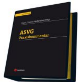
ASVG Praxiskommentar Ladenpreis: 315,00 EUR

Alle Preise inkl. MwSt. zzgl. Versand. Bei Bestellung im LexisNexis Onlineshop kostenloser Versand innerhalb Österreichs.