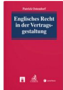
Englisches Recht in der Vertragsgestaltung Ladenpreis: 79,00 EUR