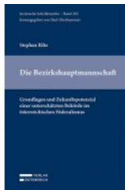
Die Bezirkshauptmannschaft Ladenpreis: 59,00 EUR