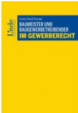
Baumeister und Baugewerbetreibender im Gewerberecht Ladenpreis: 44,00 EUR

Wir haben andere Produkte gefunden, die Ihnen gefallen könnten!