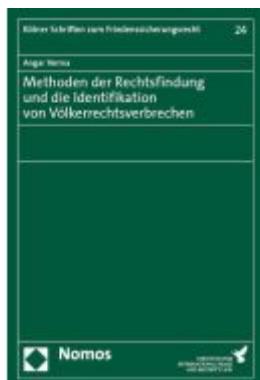
Methoden der Rechtsfindung und die Identifikation von Völkerrechtsverbrechen Ladenpreis: 86,40EUR