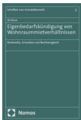
Eigenbedarfskündigung von Wohnraummietverhältnissen Ladenpreis: 142,90EUR