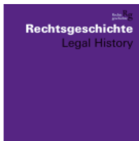
Rechtsgeschichte Legal History (RG). Zeitschrift des Max Planck-Instituts für Rechtsgeschichte und Rechtstheorie/Rechtsgeschichte Legal History Ladenpreis: 50,40EUR