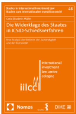
Die Widerklage des Staates in ICSID- Schiedsverfahren Ladenpreis: 149,00EUR