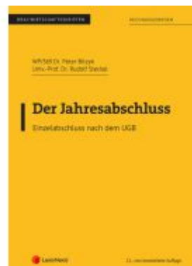
Der Jahresabschluss - Einzelabschluss nach dem UGB Ladenpreis: 22,50EUR