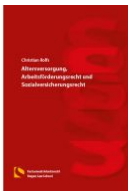
Altersversorgung, Arbeitsförderungsrecht und Sozialversicherungsrecht Ladenpreis: 20,60EUR