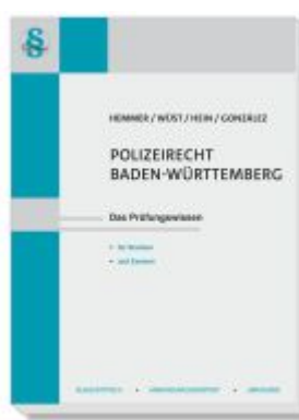
Polizeirecht Baden-Württemberg Ladenpreis: 22,50EUR