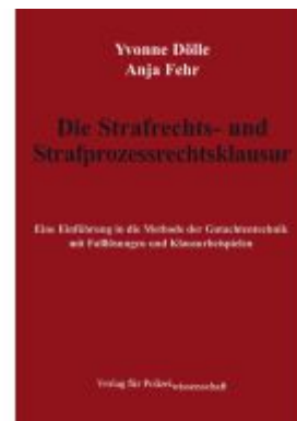
Die Strafrechts- und Strafprozessrechtsklausur Ladenpreis: 23,60EUR