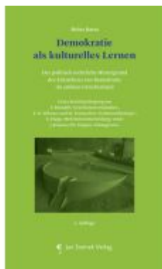
Demokratie als kulturelles Lernen Ladenpreis: 29,90EUR