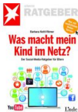
Was macht mein Kind im Netz? Ladenpreis: 9,90 EUR