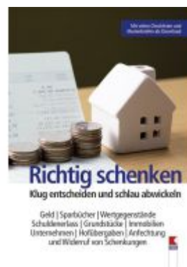
Richtig schenken Ladenpreis: 19,90 EUR