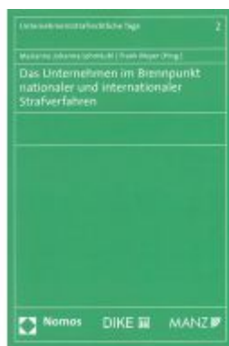
Das Unternehmen im Brennpunkt nationaler und internationaler Strafverfahren Ladenpreis: 64,00 EUR