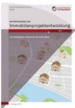
Normensammlung Immobilienprojektentwicklung Ladenpreis: 251,90 EUR