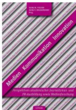
Medien – Kommunikation – Innovation Ladenpreis: 14,90 EUR