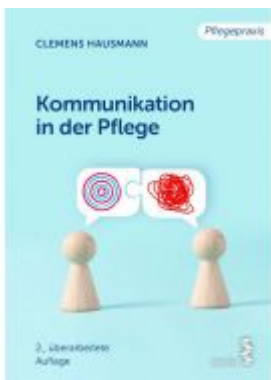
Kommunikation in der Pflege Ladenpreis: 16,90 EUR