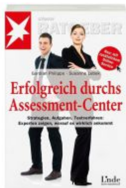
Erfolgreich durchs Assessment-Center Ladenpreis: 15,40 EUR